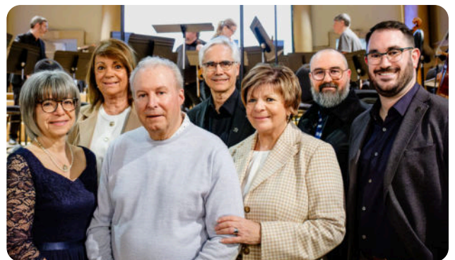
Comité organisateur du concert-bénéfice 2026